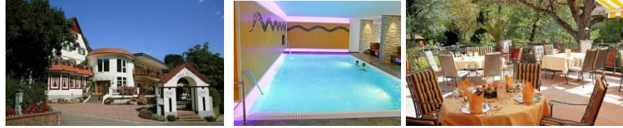
Hotel Ochsen | Höfen an der Enz (Schwarzwald) | www.ochsen-hoefen.de

In unserem Veranstaltungshotel im Schwarzwald